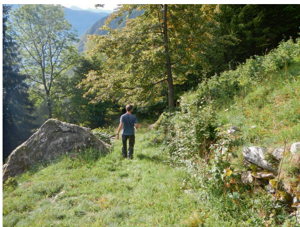
Abb. 6: Wald und Weide bei Parada.

Im untersten Teil des Tales wurde das waldreiche Gebiet zwischen Campascio und Parada/Plani untersucht, in dem auch Wiesland und Weideflächen liegen (Abb. 6).