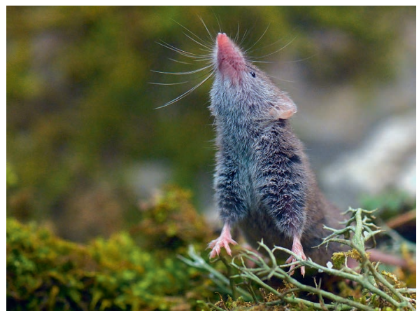
Abb. 7: Gartenspitzmaus.

Die beiden Fänge bei Campascio (FG5) sind die ersten Nachweise für das Puschlav seit 1983 (INFO FAUNA – CSCF). Ein Objekt wurde genetisch bestimmt. Die