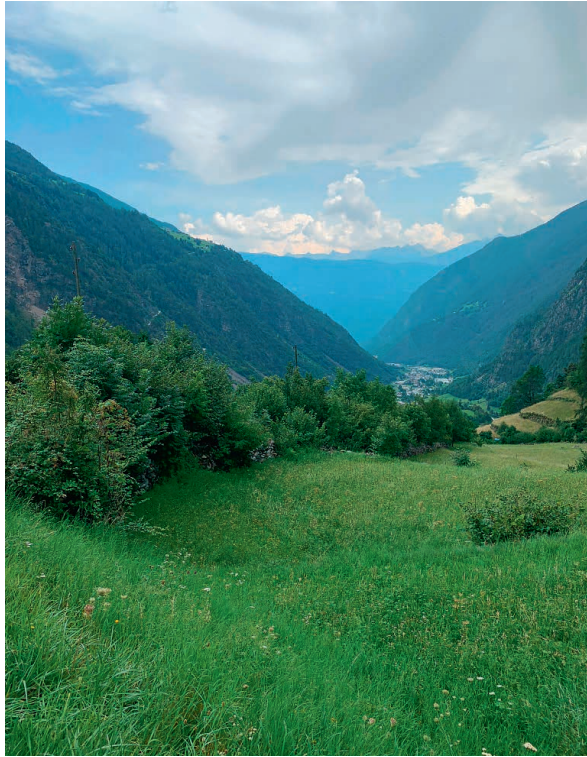
Abb. 5: Landschaft von Brusio, Cotöngi.

Im Landwirtschaftsgebiet zwischen Cotöngi und Selva-plana gliedern zahlreiche Hecken (Abb. 5) und Trockenmauern das Wiesland.