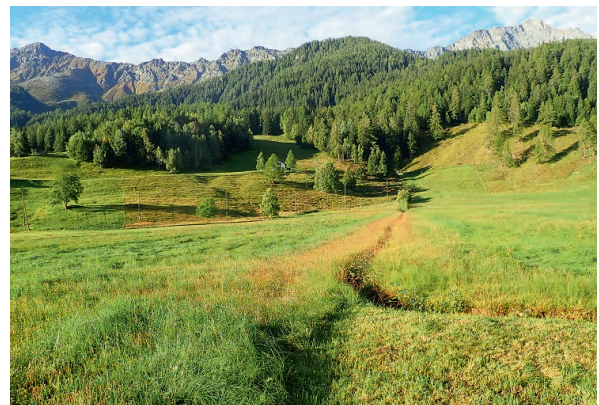
Abb. 4: Fanggebiet Selva (Foto: S. Gerber).