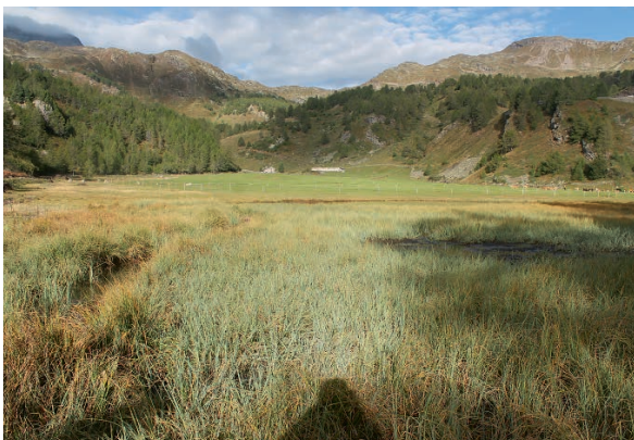
Abb. 2: Landschaft bei Campasc.

Auf der Terrasse von Selva befindet sich eine typische Maiensässregion mit Wiesen, Weiden, Wald, Wasserläufen (Abb. 4) und kleinen Siedlungen.