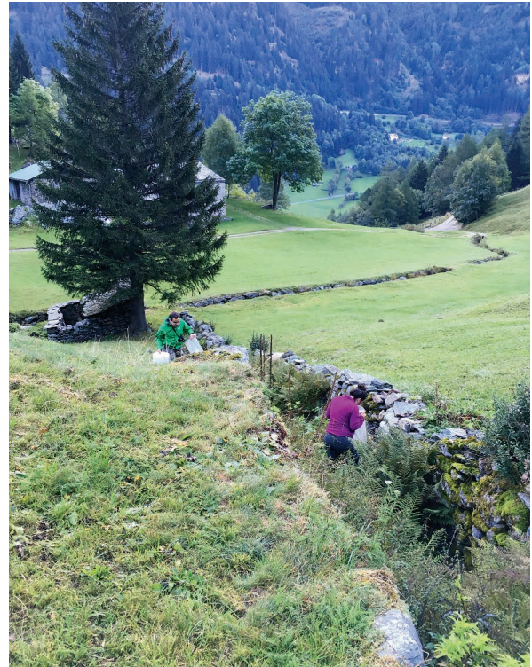
Abb. 3: Fanggebiet La Scera.

Die Maiensässregion von La Scera ist von einem dichten Waldgürtel umgeben. Bei Angeli Custodi wurde eine reich gegliederte Kulturlandschaft mit vielen Bachläufen befangen (Abb. 3).